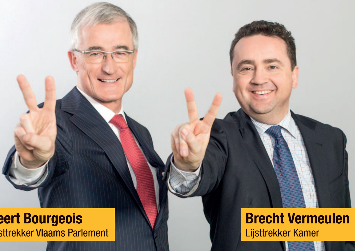
Geert Bourgeois Lijsttrekker Vlaams Parlement