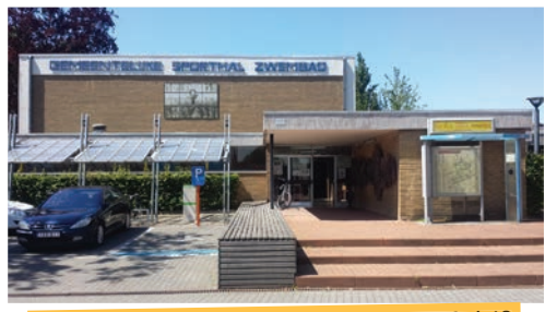
Wordt het oude zwembad nu afgebroken of niet?

Al jaren kondigt de meerderheid de komst van een nieuw zwembad aan. Na de afbraak van het oude zwembad zou het centrum van Wevelgem bovendien een warme ontmoetingsplaats worden. We zijn intussen 2015 en er is nog geen enkele aanzet gegeven tot dat beloofde nieuwe zwembad. Meer nog, volgens de meerderheid komt het er zeker al niet voor 2019.